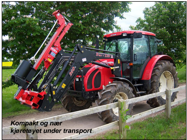
Kompakt og nær kjøretøyet under transport