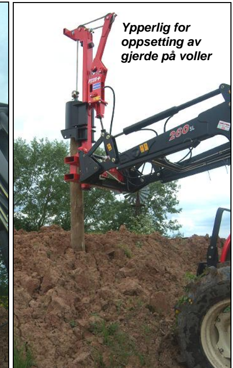
Ypperlig for oppsetting av gjerde på voller