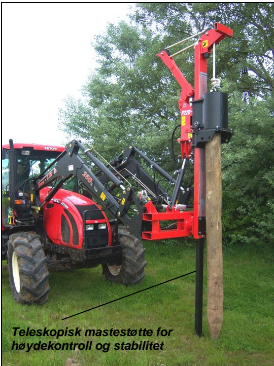
Teleskopisk mastestøtte for høydekontroll og stabilitet