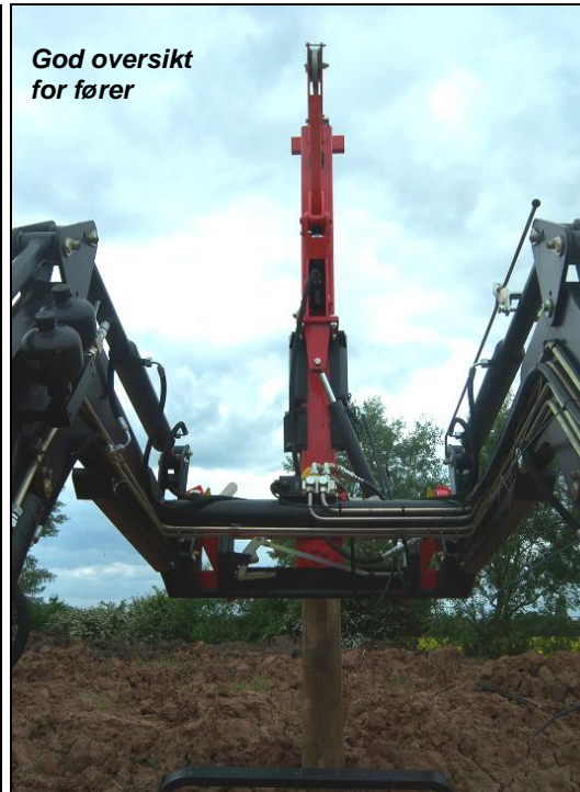
God oversikt for fører