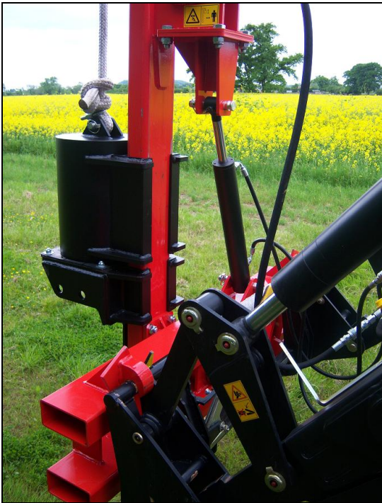
Inntil 35 grader manuell eller hydraulisk (ekstra) skråstilling. Ypperlig for hellende terreng