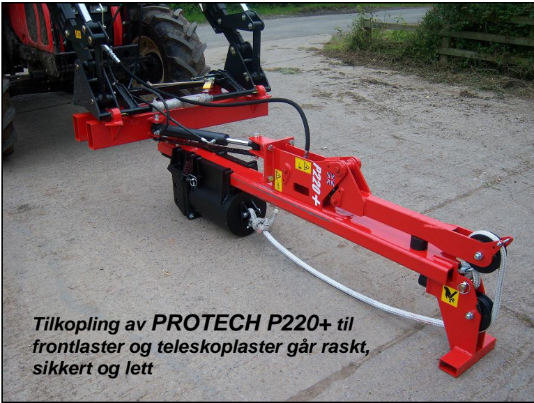
Tilkopling av PROTECH P220+ til frontlaster og teleskoplaster går raskt, sikkert og lett